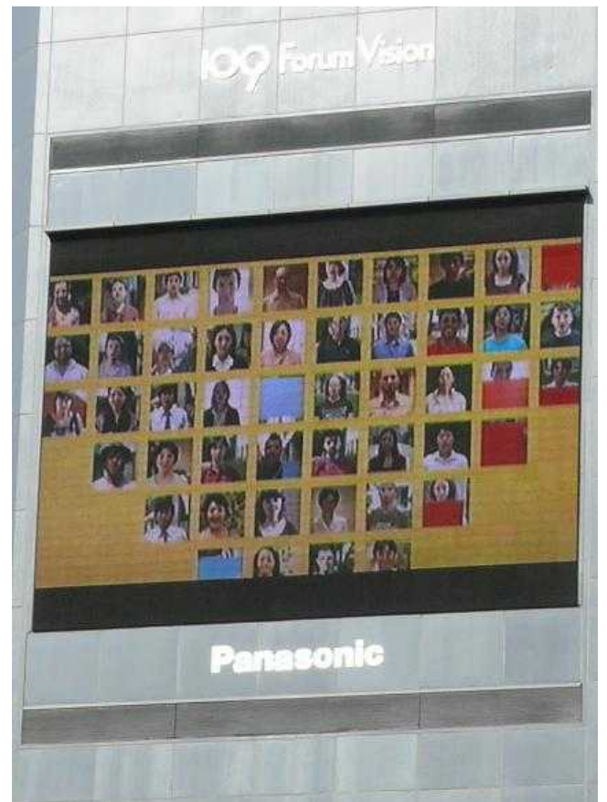
八千公前交差点渋谷 Hachikō Crossing, Shibuya