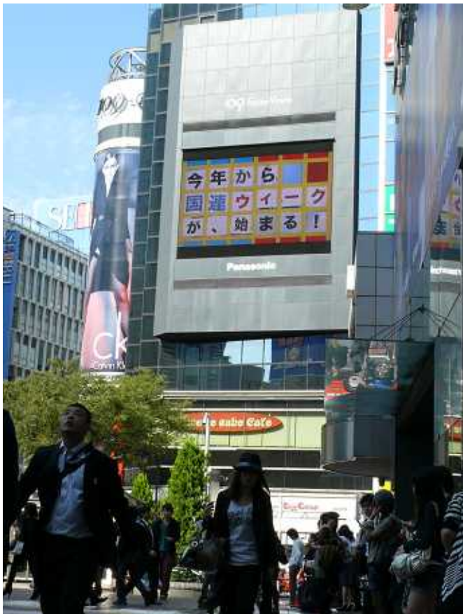
八千公前交差点渋谷 Hachikō Crossing, Shibuya